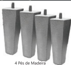
4 Pés de Madeira