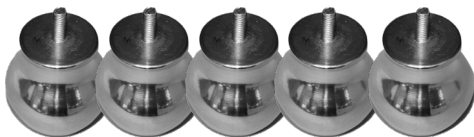
5 Pés de Madeira Revestido de alumínio